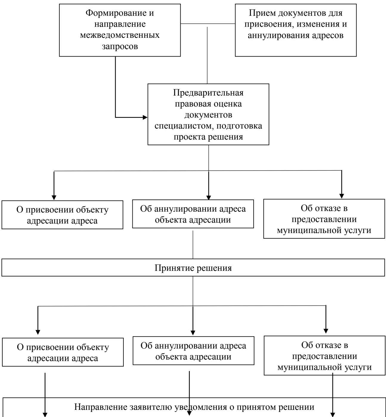
Блок-схема последовательности административных процедур при предоставлении муниципальной услуги «Присвоение (изменение, аннулирование) адреса объекту недвижимости»