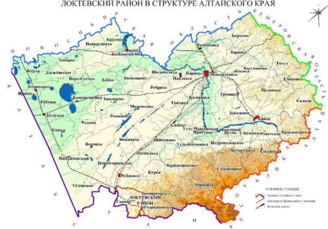
Рис. 1. Положение Локтевского района в Алтайском крае